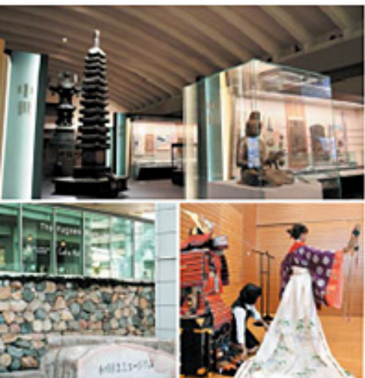
香川県立ミュージアム

玉藻公園を東門から出れば、左手に見えるのが香川県立ミュージアム。歴史博物館と美術館という2つの機能がある。ここでは、十二単や鎧かぶとの試着が無料で体験でき、童心に戻って楽しめる。ミュージアムから、南に向かって15分ほど歩けば、日本一の長さを誇る高松中央商店街にあたる。中央商店街の一つ「高松丸亀町商店街」は、再開発が進行中。今年