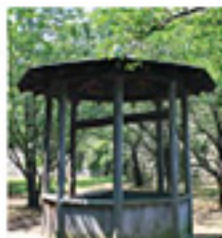
「この丸井戸」 現在も水をたたえる深さ65m の井戸。石垣を完成させた 功労者が殺された悲しい伝 説が残る。