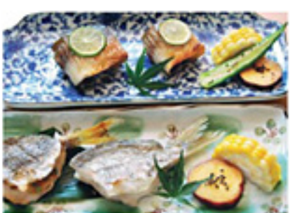
カマスの粘り焼き(上)とシズの風味揚げ(下)

始しています。道の駅「源平の里 むれ」の食堂での海鮮メニュー、小豆島特産のオリーブやしょうゆと組み合わせたゼリー、洋菓子店のデザートなど、さまざまに工夫され使用されています。次の新しい商品が今からとても楽しみです。