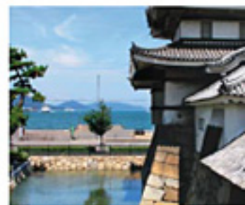
直接海に向けて開く海城特有の「水手御門」(右手前)

知らない街を歩くことは、旅の醍醐味のひとつ。徒歩のリズムで見た景色は、心の奥まで入ってくる。史跡があり、自然があり、人との出会いもある。秋の旅は、のんびり香川へ。