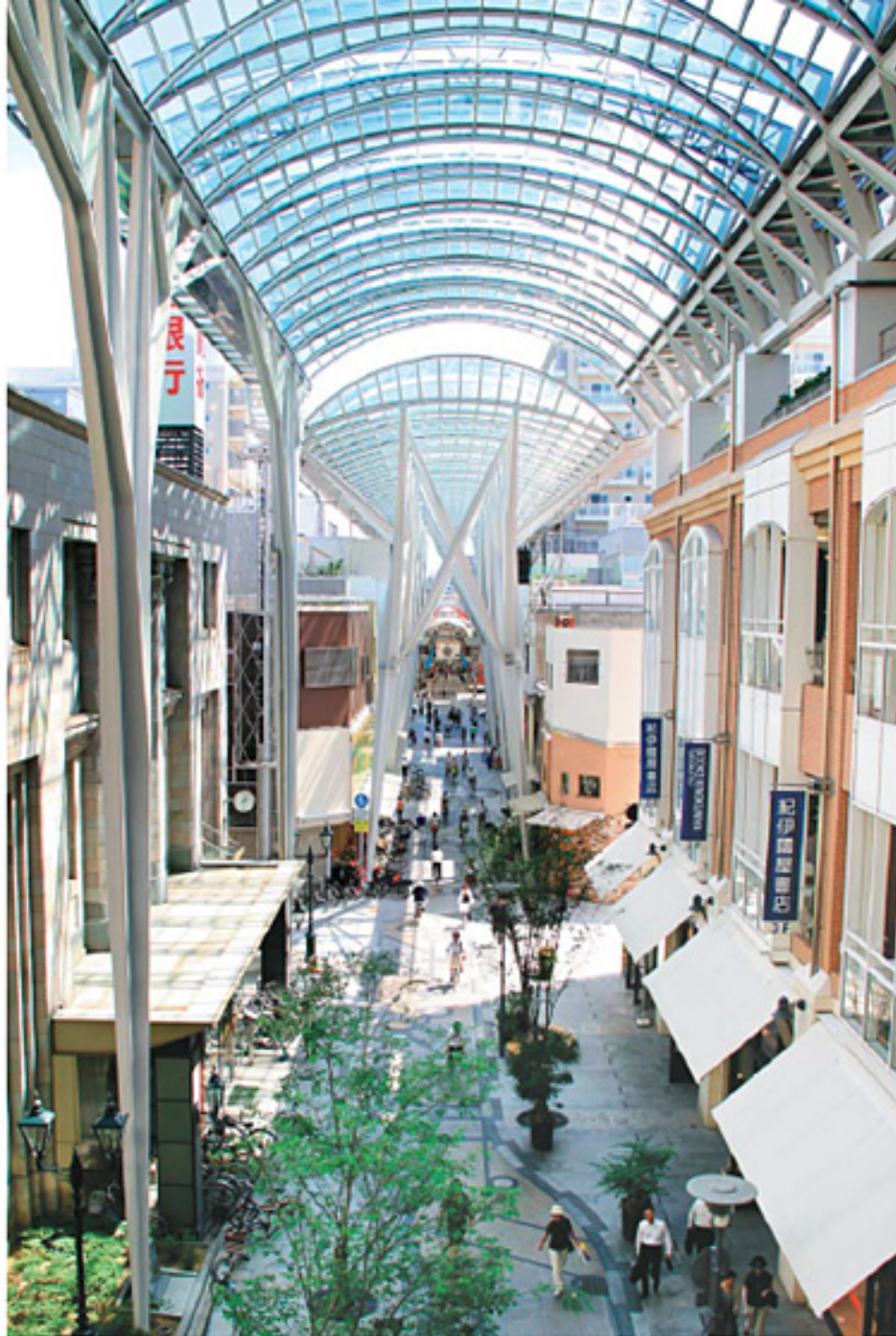
観光地やビジネス街にも近い高松丸亀町商店街

香川県立ミュージアム 開館時間/9:00~17:00 休館日/月曜(祝日の場合は翌日) TEL087-822-0247