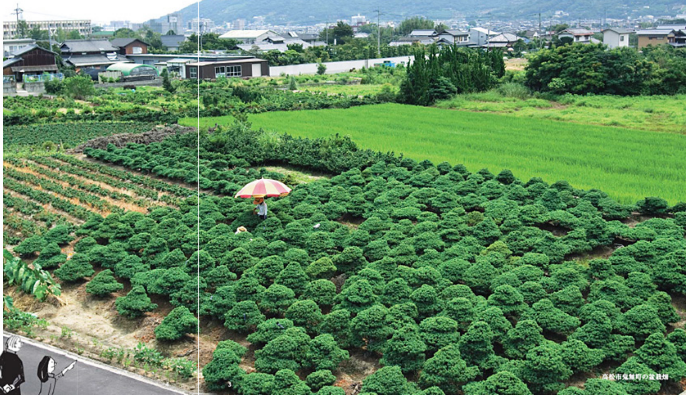
高松市鬼無町の盆栽畑