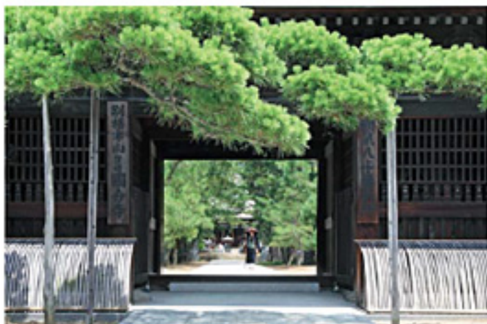
四国八十八箇所霊場第80番札所「讃岐国分寺」