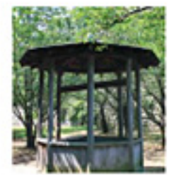
「二の丸井戸」 現在も水をたたえる深さ65m の井戸。石垣を完成させた 功労者が殺された悲しい伝 説が残る。