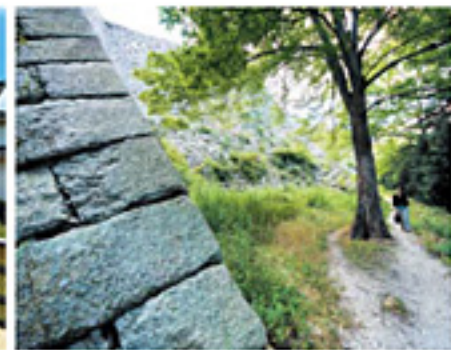
「見送り坂からの脇道」 見送り坂から西へ入る脇道。 ここからは、ちょうど石垣が 折り返って見える。