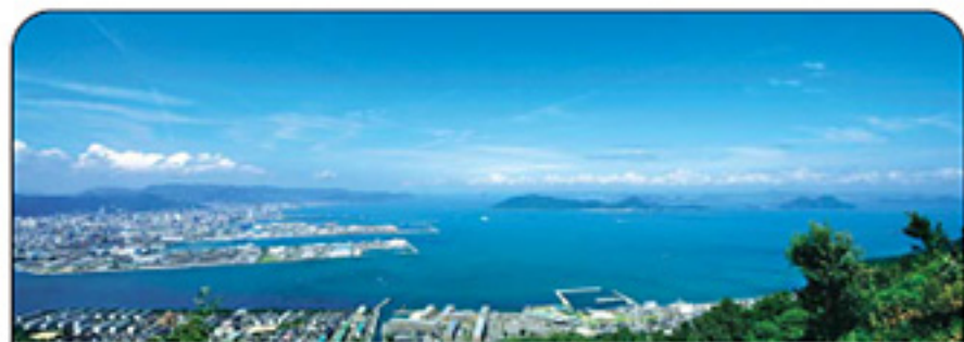
屋島山頂からの眺め