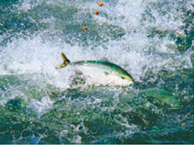
オリーブを与えると背帯が濃くなるのが特徴で、深い味わいとさっぱり感が増す。

まり、養殖だからこそ本物をお届けできるというわけだ。 中でも「オリーブハマチ」は、その名の通り県花・県木である「オリーブ」の葉の粉末をエサに与えて誕生した。オリーブオイルは、生活習慣病予防や老化防止に効果があるといわれているが、オリーブの葉にはポリフェノールの一種「オレウロペイン」が豊富に含まれる。健康志向が強い現代人にはうってつけ。ところで、「鯛」は出世魚。香川県では、成長に合わせて、モジャコ、ツバス、ハマチ、ブリと呼ばれる。地方によって、その名前や呼ぶ時期も変化するのだが、香川では県魚である「ハマチ」が喜ばれ