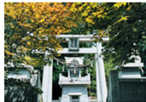
樹木や草花をつかさどる神を祭る盆栽神社