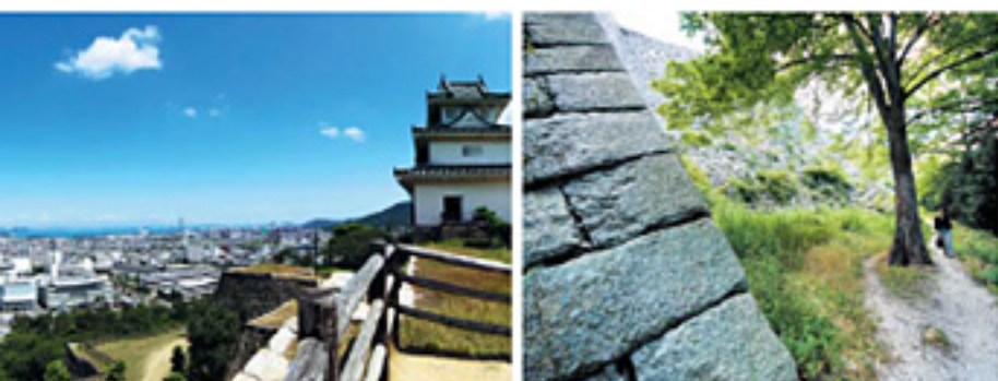
「見送り坂からの露道」 見送り坂から西へ入る露道。 ここからは、ちょうど石垣が 折り返って見える。