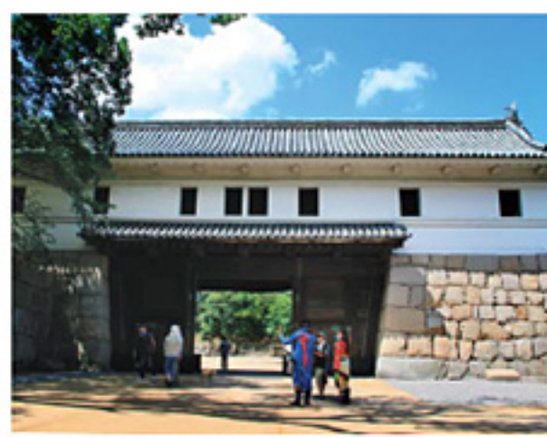
「大手一の門」 丸亀城のメインゲート。橋上に太鼓を置き、 城下に刺を知らせたことから太鼓門とも呼ばれる。

「丸亀城バサラ京極隊」 粋で奇抜な丸亀藩家臣のオリジナル衣装をまとった 丸亀城の観光案内係。 土・日・祝日はパフォー マンライブも行う。 平成24年3月31日まで。